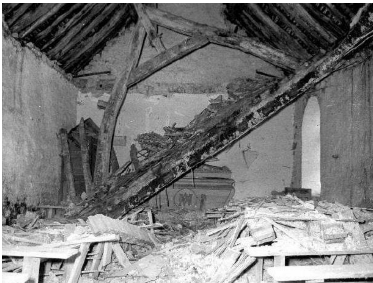
Toit écroulé

Bien moins d'un siècle après la bénédiction de cette nouvelle cloche, à savoir en 1972, une entreprise a procédé à la démolition de la Chapelle dont une partie du toit était écroulée [voir photos].