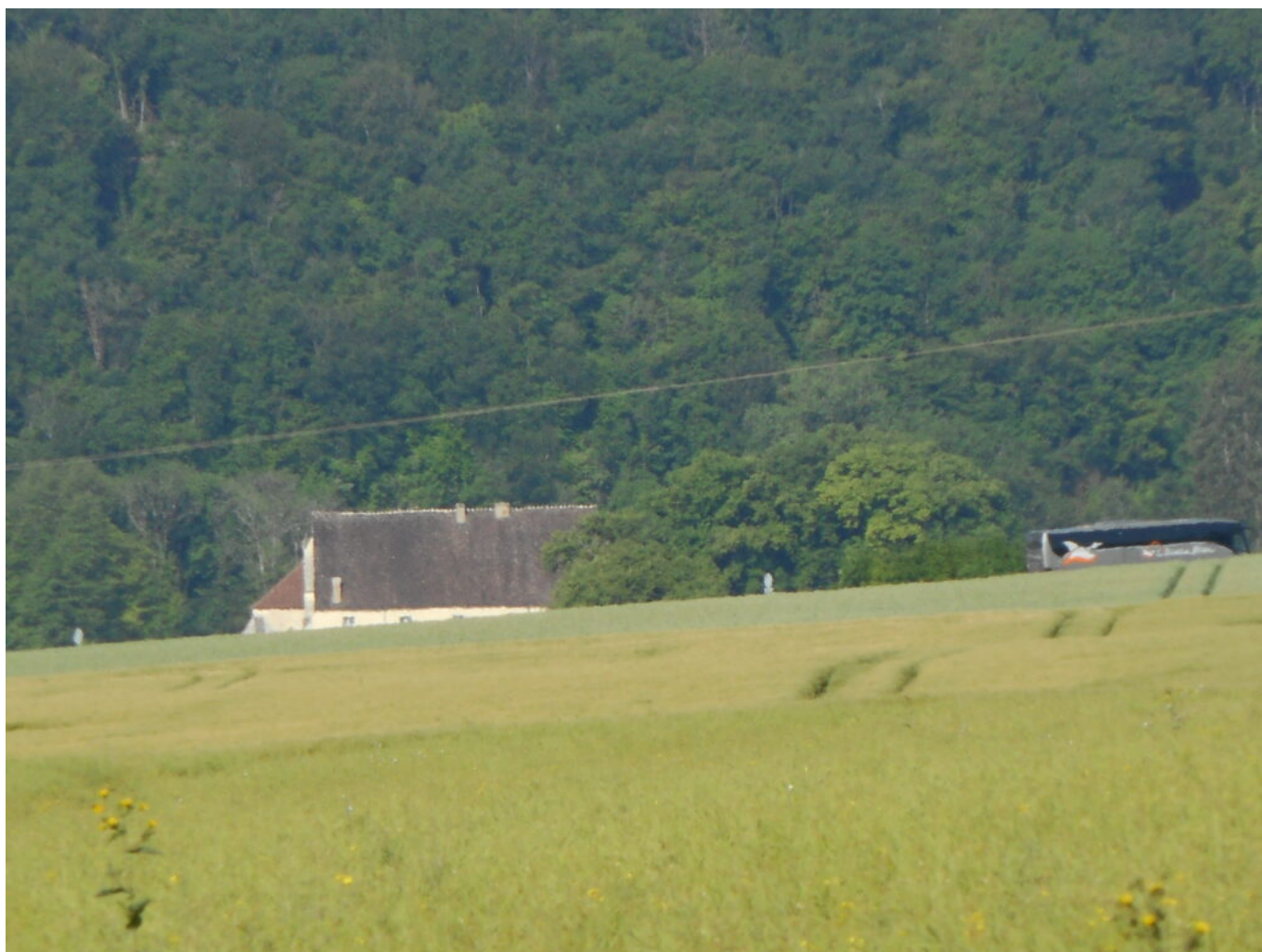
L'abbaye de Reigny vue au téléobjectif de la métairie de la Femme Morte