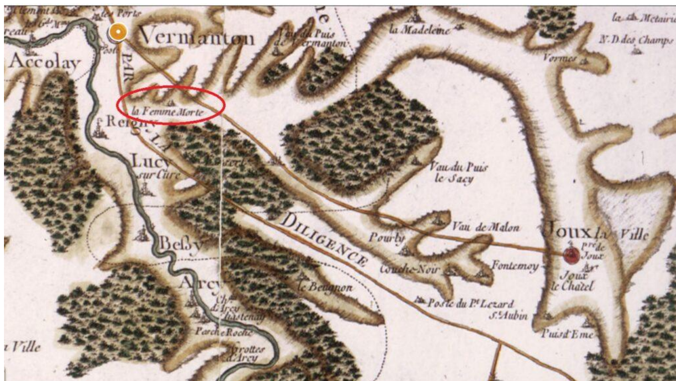
La Femme Morte, Carte de Cassini (1750)

Depuis ce virage, de part et d'autre de cette route menant face à Reigny (donc sur les paroisses d'Essert et Vermenton), se trouve un espace agricole nommé « La Femme Morte ».