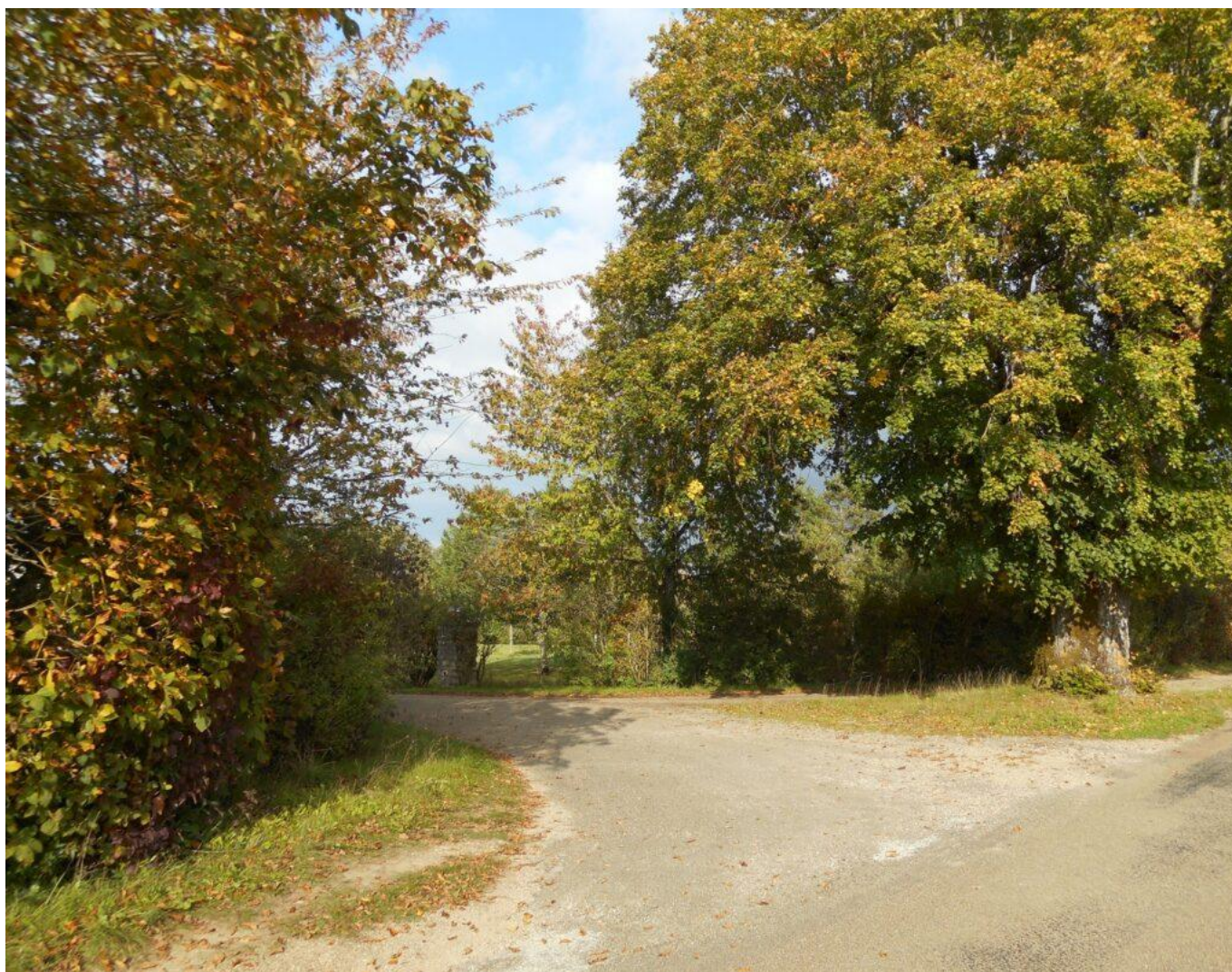
La ferme de la Loge de Sacy :