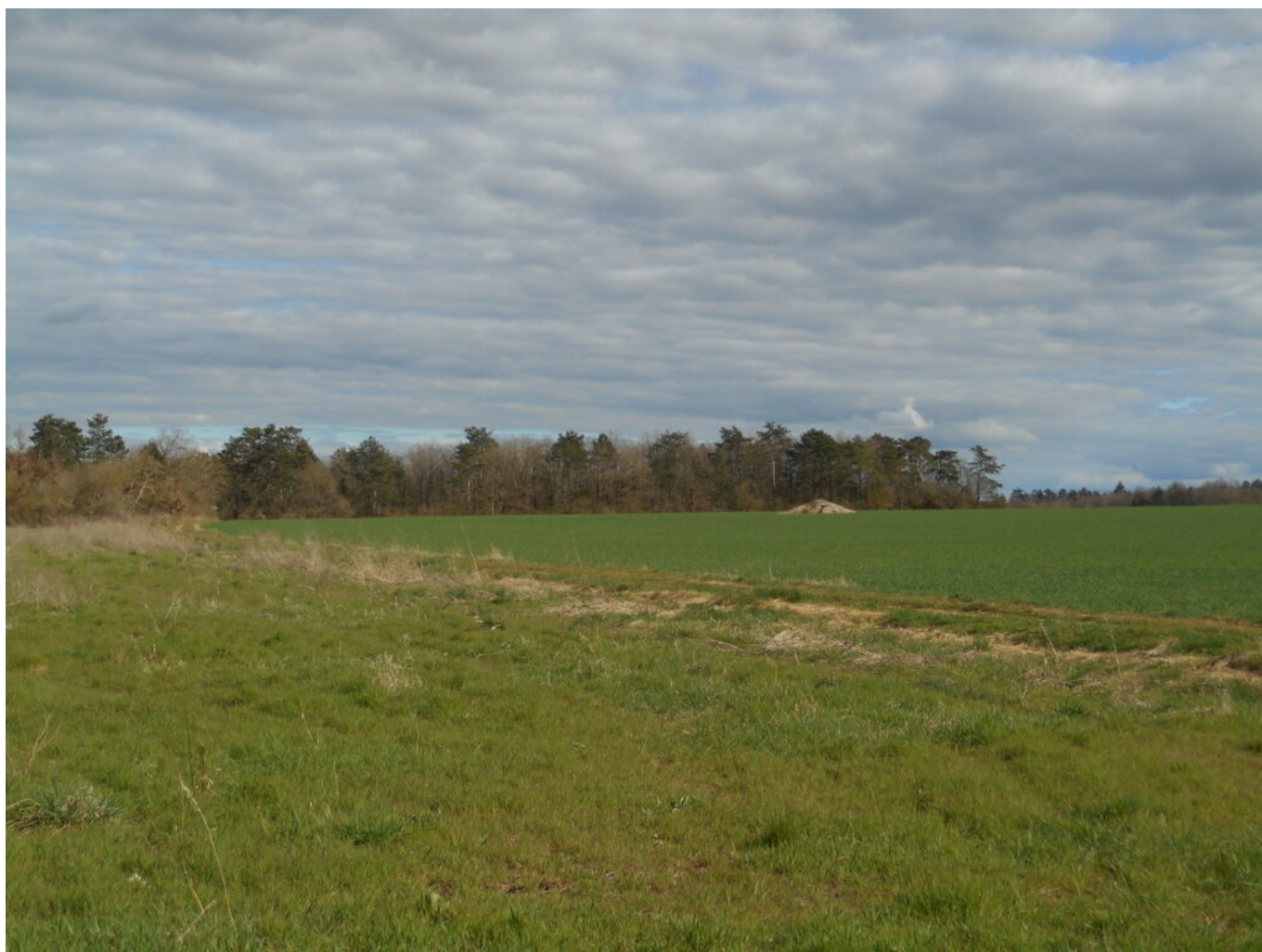
Le haut de la Vallée de la Creuse, à droite de la lisière boisée, comme on le voit de La Chapelle (zoom)