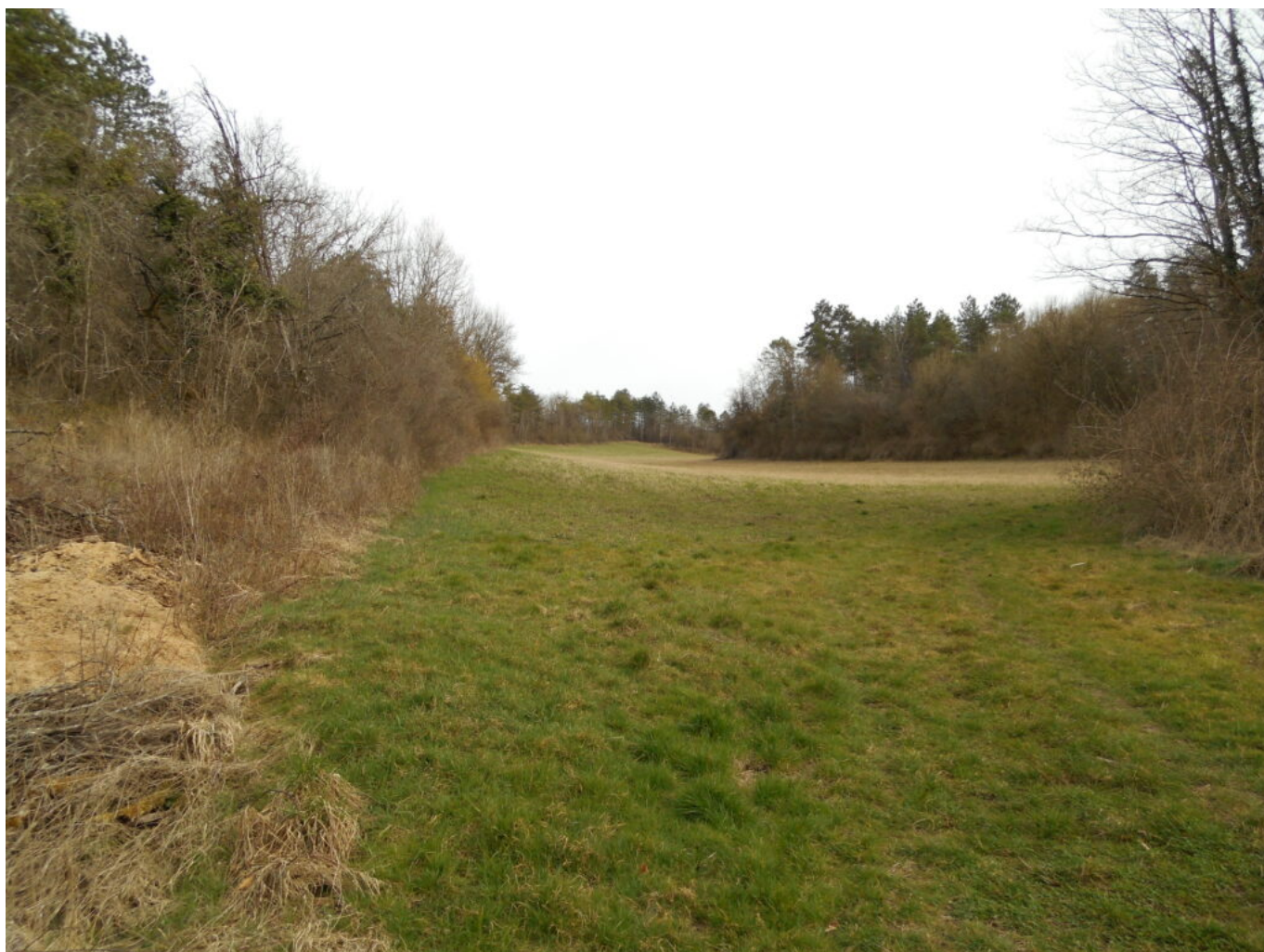
Vallée de la Creuse