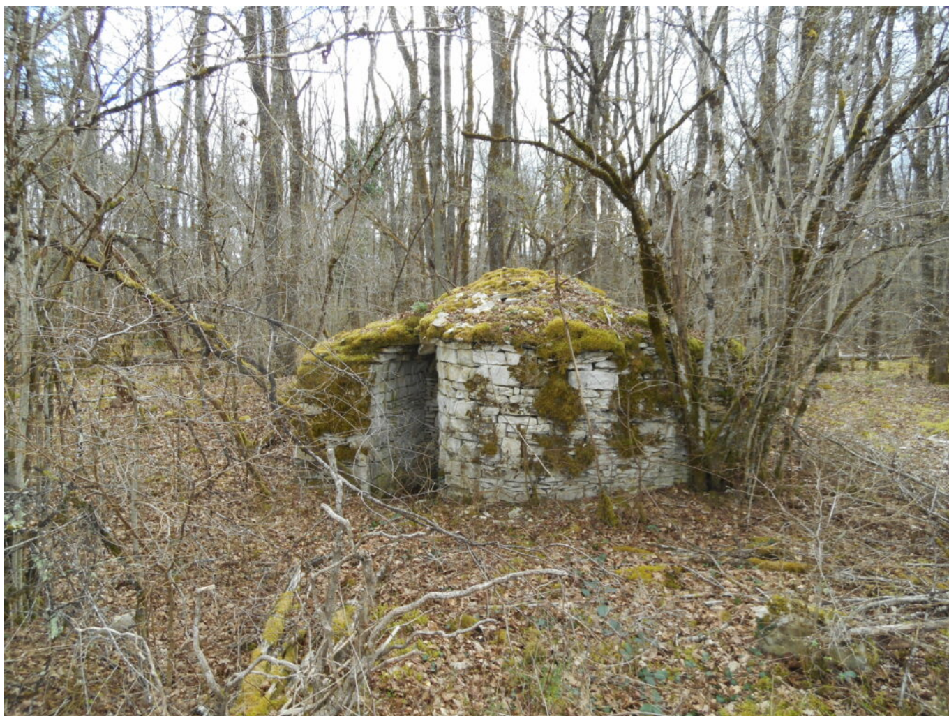
Dans le bois de la Chapelle Saint-Thibault

Or le lieu « La Chapelle St-Thibault » se situe bien dans la section dite « du Bois Pailleau » sur le cadastre Napoléonien. Le Val-du-Puits est à la limite Est de cette section. Le chemin « ligne des Tremblats » sépare dans les bois communaux de Sacy la partie Val-du-Puits de celle de la « La Chapelle St-Thibault ».