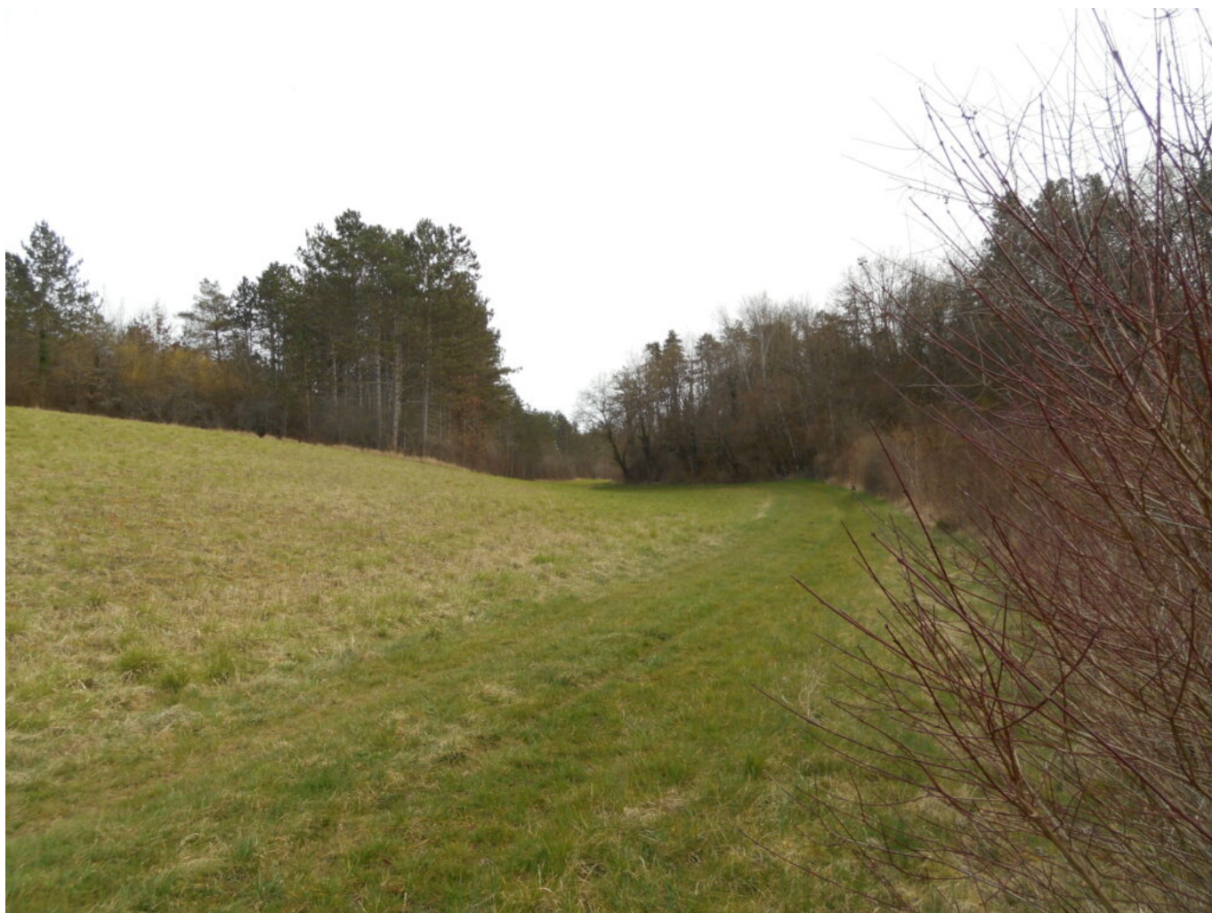
Vallée de la Creuse