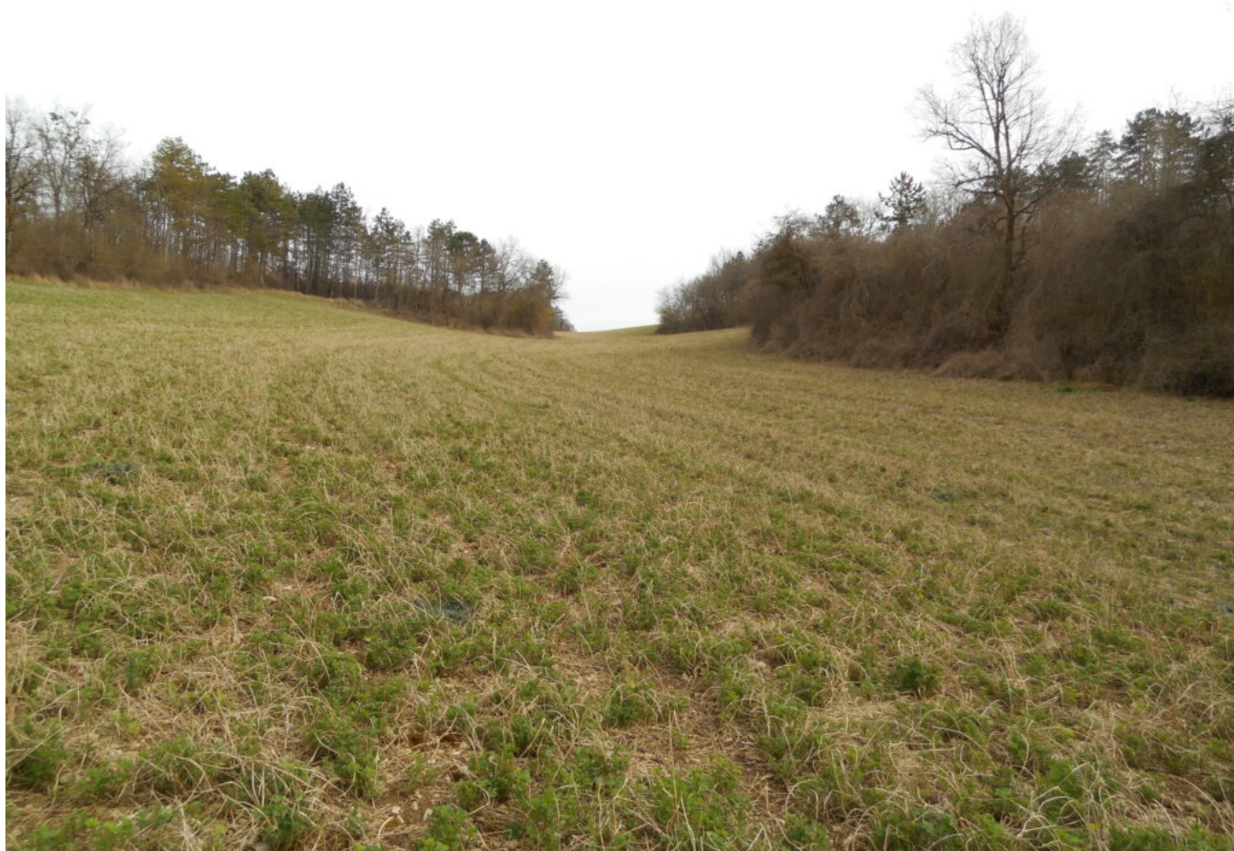
Vallée de la Creuse

De l'autre côté, le coteau du Vau-Franc (côté sud de la vallée homonyme) permettait d'accéder à l'ancienne route menant à Vermenton. La vallée du Vau-Franc est boisée, très encaissée, un sentier peu large et peu sécuritaire. Il existe un vieux chemin qui est parallèle à la vallée et débouche au même endroit. Mais rien ne permet de dire depuis quand ce chemin existe.