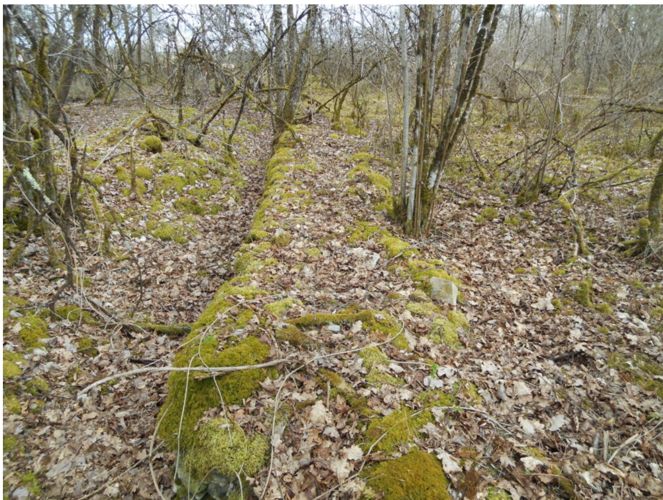
Autre photo du muret dans le bois de La Chapelle Saint-Thibault

Rappelons que le Cartulaire fait état pour la dernière fois de Merry en 1566, relevé sur le terrier (registre) de Palluau-Vau-du-Puits, archives de l'Yonne. (Le livre terrier ou terrier s'imposent au XV e siècle comme outil de l'administration seigneuriale).