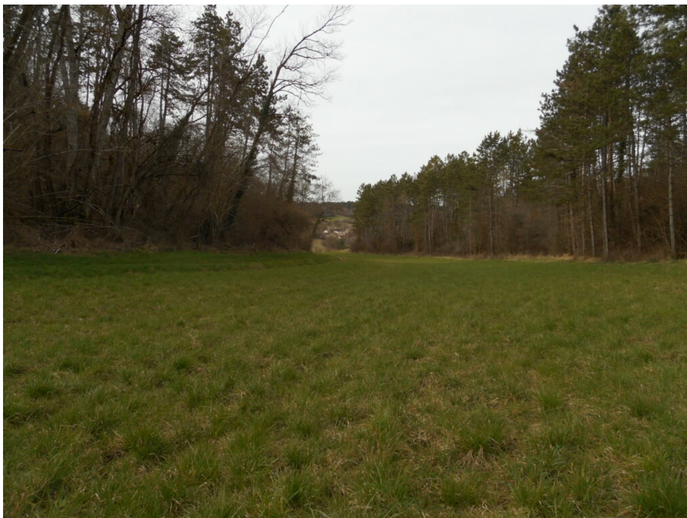
Vallée de la Creuse