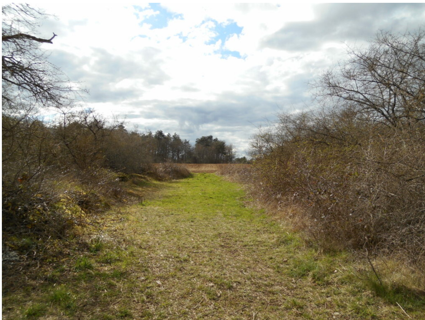
La Chapelle St Thibault vue de la route actuelle menant au Val-du-Puits de Sacy

« La Chapelle St-Thibault » est bien située sur la route de Joux (400m). Ce lieu ne peut qu'être l'endroit où était établi le bourg de Merry. L'emplacement était bien situé. Il permettait en étant sur place de cultiver ces terres assez éloignées de Sacy et du Val-du-Puits. L'ancienne route de Joux, si elle existait bien à cette époque permettrait de venir à Sacy. Mais ce qui est certain, la vallée de la Creuse qui est bien large et en pente douce et régulière, permettait de se rendre à Sacy. Cette vallée aboutit à une extrémité de Sacy côté Joux.