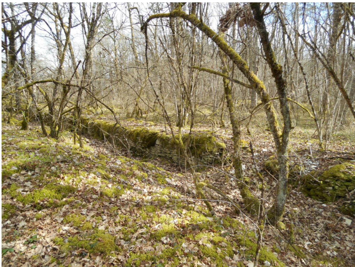
Muret dans le bois de La Chapelle Saint-Thibault

Cette appellation « La Chapelle St-Thibault » n'est pas anodine. Il devait bien y avoir une chapelle sur ce site pour donner son nom à l'endroit. Elle ne figure pas sur la carte de Cassini donc n' existait déjà plus en 1750.